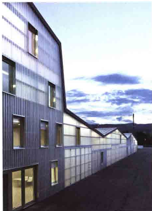
Bunq Architectes: Kontor for Trafik- og infrastruktur, 2012 Gland, Schweiz